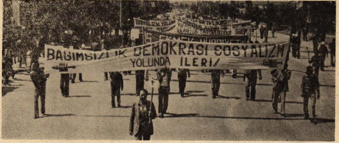
Çorum'da 15 - 16 Haziran yürüyüş ve mitingi

Maocuların TSİP Çorum mitingindeki provokasyonunu belirten Gürcan, TSİP'in maoculara karşı en etkili mücadeleyi vermekte olduğunu, gene partinin sapmalara karşı kararlı bir ideolojik mücadele sürdürdüğünü söyledi. Sosyalist hareketin birliğinde partinin karşılaştığı bölücü hücumlara rağmen,